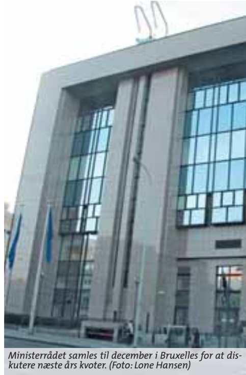
Ministerrådet samles til december i Bruxelles for at diskutere næste års kvoter.

Nogle bestande er der kvoteforslag til. Der lægges fra EU-side op til væsentlige nedsættelser af sildekvoterne. I området vest for Skotland foreslås det konkret at reducere sildekvoterne med 25 procent. Til gengæld vurderes der at være basis for at forhøje tungekvoten i Nordsøen med syv procent. For pighaj og sildehaj foreslås der en nul-TAC, og for byrkrelange er udspillet